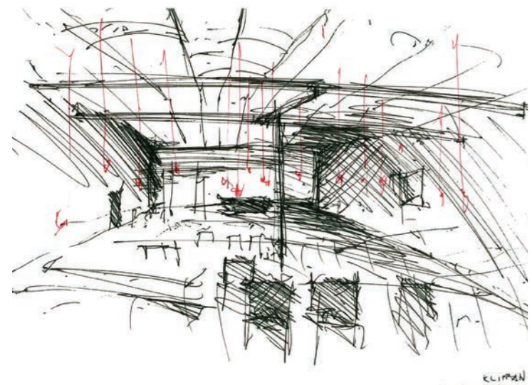
Sigurd Lewerentz, Cerkev Sv. Petra v Klippanu, Danska, 1966

Christian Norberg-Schulz; Nightlands, Nordic Building