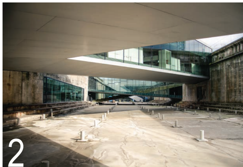
2 BIG: Danski nacionalni pomorski muzej, Helsingor, Danska, 2013