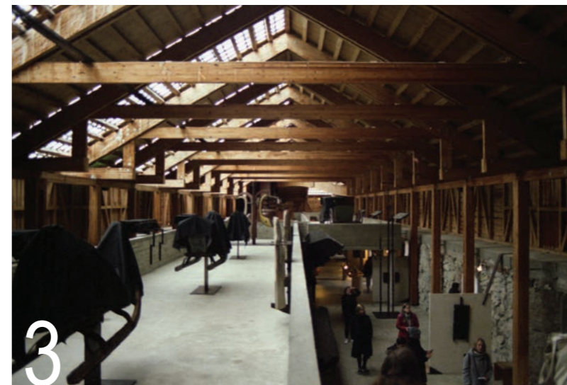
3 Sverre Fehn: Muzej Hedmark, Hamar, Norveška, 1973