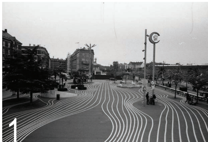
1 BIG, Topotek 1, Superflex: Superkilen park, København, Danska, 2012